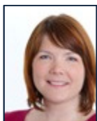
Marie Stærke Socialdemokraterne